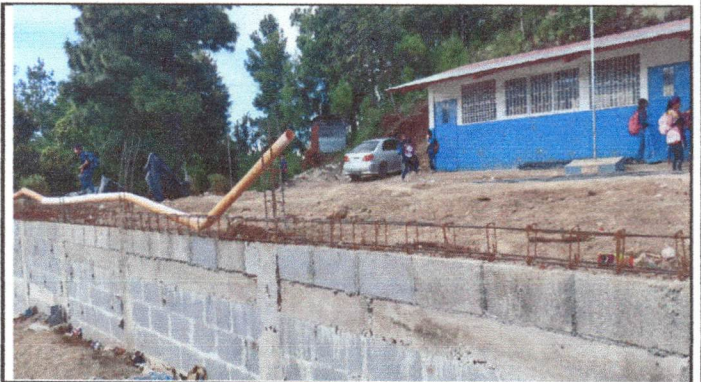
Foto 4: Reparación de muro perimetral de block con tubo hg y malla galvanizada, soleras intermedias y columnas.